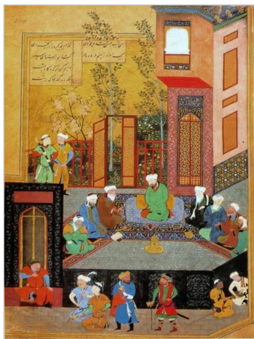
Behzod. "Iskandarning yetti yunon donishmandi bilan suhbat". Hirot. 1494-95- yillar. Nizomiy. "Xamsa". London. Britaniya muzey qo'lyozmasi.

uning vazifasi xalqning madaniy boyligi sifatida, o'sha millat va elatni dunyoga olamshumul asarlarini tanitish, uzoq kelajakka yetkazishdan iboratligi har bir davlatning ma'naviy boyligi hisoblanadi. Hayotda barcha narsa o'zining yaratilish tarixi bilan qimmatlidir. Har bir yaratilgan tarixiy miniatyura asarlarida xalqning barcha madaniy boyliklari o'zining ifodasini topishi bilan birga, uning urf-odatlarini katta mahorat bilan yaratilganligiga amin bo'lasiz. Tarixdan hozirgi davrgacha bo'lgan davriylikni to'laligicha ochib berish va san'at muxlislarining ijodiy janrlar haqidagi bilimlarini yanada kengaytirishdir. Yaratilgan asarlarning o'z zamon san'ati bilan bog'liqligi, ularni janrlar asosida yaratilganligi, kompozitsiyalarini oddiy yechimdan to, murakkab yechimgacha bo'lgan chizgilardagi jarayonlarni anglash uncha murakkab emasligidadir. Qadimgi Sharq miniatyura san'ati tarixida Arab miniatyura maktabi, Turk miniatyura maktabi, Hind miniatyura maktabi, Ozarbayjon miniatyura maktabi, Eron miniatyura va Sharq miniatyura maktablarini o'ziga xosligi bilan bir - biridan ajralib turibgina qolmay, ranglarning nafisligi, uyg'unligi, obrazlar nozik chizgilarining aniqligi,