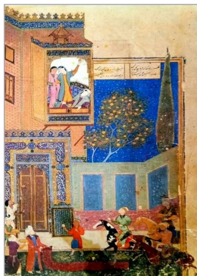
Behzod. "Xusrav Shirin qasri oldida". Hirot. 1524-25- yillar. Nizomiy. "Xamsa". Nyu-York. Metropoliten san‘at muzeyi.