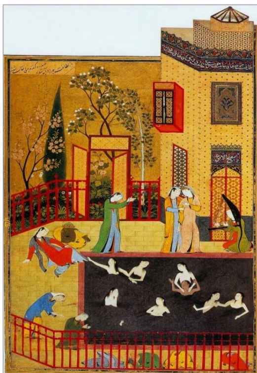
Behzod. "Cho'milayotgan qizlar". Hirot. 1494 -yil. Nizomiy. "Xamsa". London. Britaniya kutubxonasi.

Miniatyura asarlaridagi tasvirlar orqali ma'lum bir voqeani ko'rsatish, insonlarning bir - biriga hurmat bilan qarash kabi g'oyalarni ilgari suradi. Miniatyura san'ati musavvirdan nihoyatda nozik didlilikni, keng dunyoqarashni, yurak hislari orqali har bir chizgini, mazmun mohiyatini ko'ngildan o'tkazishni talab qiladigan san'at turidir. Ma'lumki, qadimda IX-XIX asarlarda Yaqin va O'rta Sharq mamlakatlari, Ozarbayjon, Eron xalqlari bilan buyuk ipak yo'li orqali aloqada bo'lib kelganlar. O'sha davrlarda Samarqand, Buxoro kabi shaharlarda madaniyat juda rivojlangan bo'lib, bu shaharlar taraqqiyot markazlari bo'lib ham xizmat qilgan. Qadimda ilm-u ma'rifat yuksak qadriyat sifatida qadrlanishi bilan birga, miniatyura bilan kitob muqovalari, sahifalari kitobning mazmun mohiyatidan kelib chiqqan holda bezatilgan. Miniatyuralar asosan she'rlar,