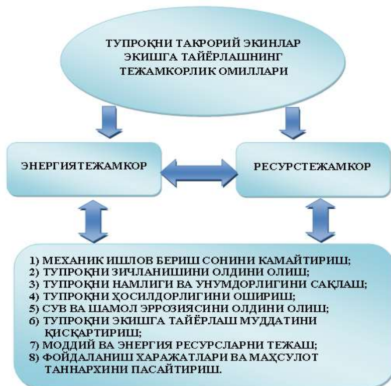
1- rasm. Tuproqqa ishlov berish va uni ekishga tayyorlashda asosiy tejamkorlik omillari

So‘nggi yillarda jahon amaliyotida nol ishlov berish va to‘g‘ridan-to‘g‘ri ekish maydonini ko‘paytirish tendensiyasi yaqqol ko‘rinmoqda [3]. Ammo, bunday ishlov berish usullarida begona o‘tlar ko‘payadi, bu esa gerbisidlar va o‘simliklarni himoya qilish vositalaridan ko‘proq foydalanishni talab qiladi, natijada mahsulot tannarxi sezilarli darajada oshadi.