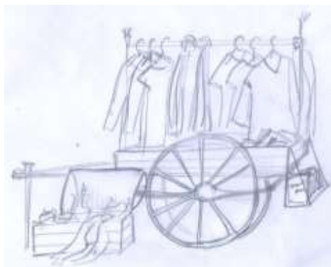
Рис.3 Рабочий эскиз Pop-Up-Shop в торговом центре в виде арбы

Другие варианты - идея обмена товара и продажа изделий «Recycling» и «upcycling», а также «freecycling».