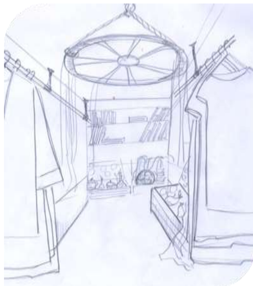
Рис.2 Рабочий эскиз внутреннего пространства магазина

Второй вариант - это Pop - Up - Shop, который будет располагаться в торговом центре. Обычно в больших торговых центрах всегда есть место по центру в виде холла, которое может быть занято под проведение презентаций или развлекательных мероприятий. Pop-Up-Shop будет представлять собой лавку - арбу с товаром (рис.3).