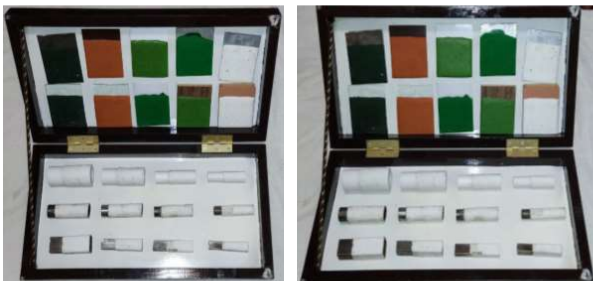
1-Rasm. Issiqlikni saqlovchi qoplamani xar qanday materialga birdek yopishishi.

Ushbu material mikrosfera va akril bo'yoqlari (yana bir nechta kimyoviy moddalar) asosida tayyorlanadi. Yuqori yopishqoqlikka egaligi (xar qanday materialga birdek g'isht, shisha-oina, matell, plastmassa, gips, sement-qumli joylar, beton, yog'och va xokazo), sovuq yuzalarda korroziya xosil bo'lishini oldini olishi va xar qanday yuzaga birdek yotqizilishi bilan ajralib turadi. 1-Rasm.