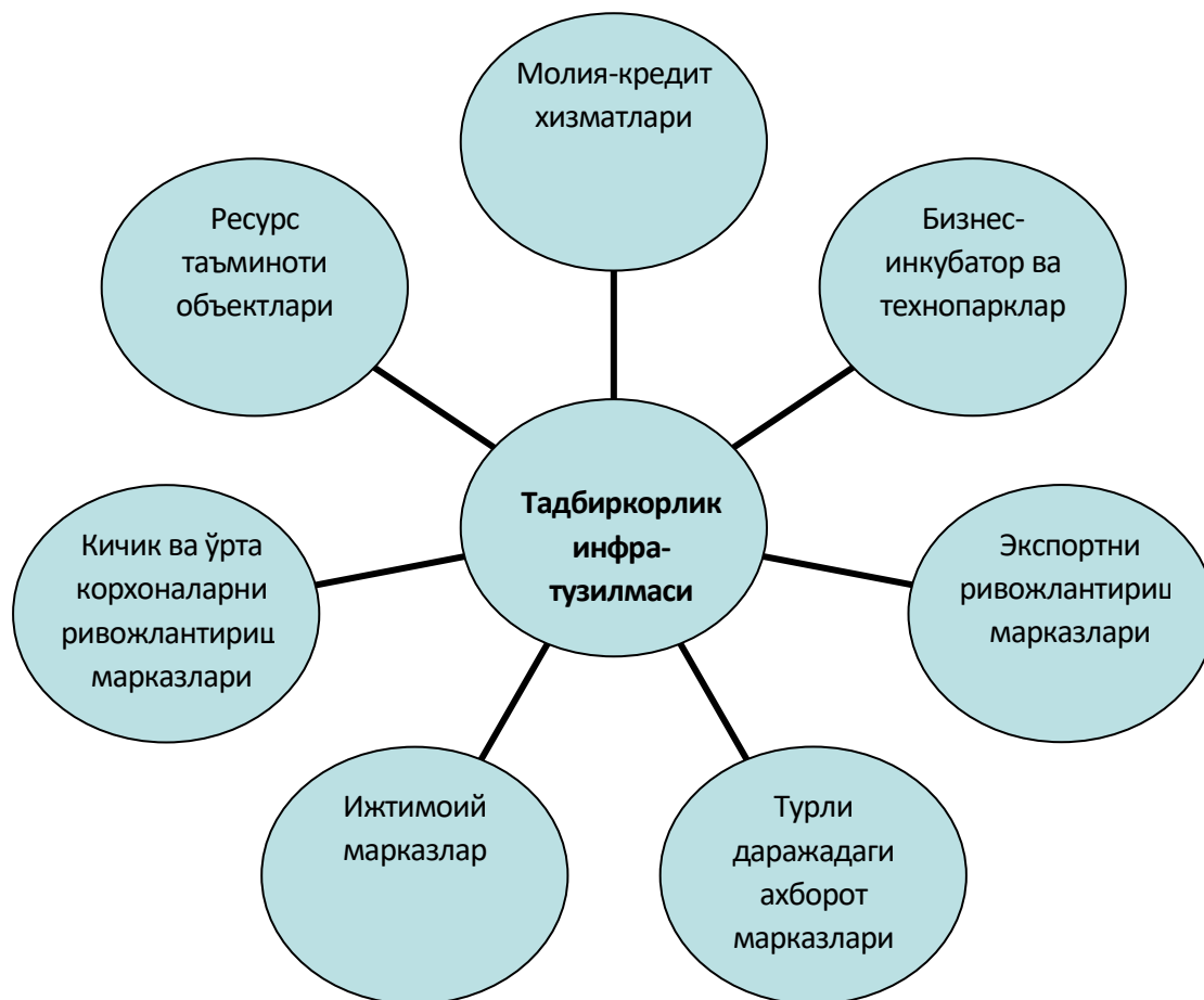
3-расм. Ривожланган мамлакатларда тадбиркорлик инфратузилмаси таркиби [31]

Ривожланган мамлакатларда кичик тадбиркорлик субъектларига хизмат кўрсатувчи инфратузилманинг ривожланган тармоғи мавжуд бўлиб, бу ҳол тадбиркорлик субъектларининг молия-кредит, ахборот, ўқитиш, экспорт қилиш ва бошқа хизматлардан фойдаланиш имкониятларини яратади (3-расм).