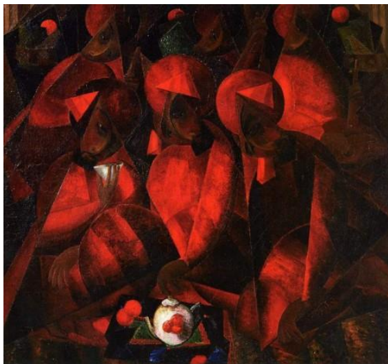
Александр Волков. Анорли чойхона. 1924 йил. Мато, мойбўёқ. Третьяков Давлат галереяси.

А.Волков Ўзбекистон ҳаётини яхши билар, юрагидан Шарқ инсонларини ва рангини севар, шу боис унга ўз ҳаётини бахшида этганди. А.Волков ўз ижодини Тошкентда бошлаб умрининг охиригача, деярли ярим аср тасвирий санъатда сермахсул ижод этди. Унинг яратган асарлари йирик музейлардан Рус Давлат музейи, Третьяков Давлат галереяси, Шарқ халқлари санъати музейи, Нукус Давлат санъат музейи, Ўзбекистон Давлат санъат музейлари ва шахсий тўпламларда сақланмоқда ва намойиш этилмоқда. “Анорли чойхона” асари ҳам бугунги кунда Третьяков Давлат галереясининг шох асарлари қаторидан жой олган бўлиб, бу даврда ижод қилган рассомлар маҳоратини намоён этади.