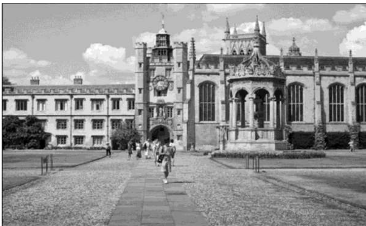
2-rasm: Kembrijdagi universitet

XX-asr yangi ilg'or tipdagi dam olish muassasalari - yoshlar markazlarining ko'p funktsiyali majmualar arxitekturasi faol shakllanish davri bo'lib, ularda madaniy dam olish, rivojlanish, ta'lim va sog'lom turmush tarziga maksimal darajada e'tibor qaratiladi. Bu jarayon ayniqsa sobiq SSSR da yaqqol namoyon bo'ladi, u erda me'morlar ijtimoiy buyurtma asosida Yoshlar saroylari va Yosh proletarlar uchun madaniyat uylarini yaratdilar.