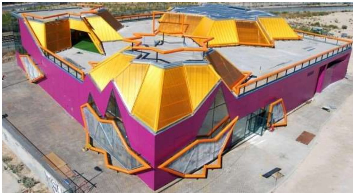
3-Rasm: Rivas Yoshlar markazi.

2009 yilda Ispaniyada qurilgan Rivas zamonaviy yoshlar markazi, me'morlarning g'oyasiga ko'ra, mashhur er osti madaniyatining timsoli va Madrid chekkasidagi yoshlar ruhining namoyon bo'lishi sifatida joylashtirilgan. Madridning yosh iste'dodlari dizaynni ishlab chiqishda faol ishtirok etishdi, natijada markaz yorqin fasad va interyerga ega bo'ldi. Dizaynerlar va me'morlar hamma joyda Madrid madaniyatida mavjud bo'lgan to'yingan ranglardan foydalanganlar.[5]