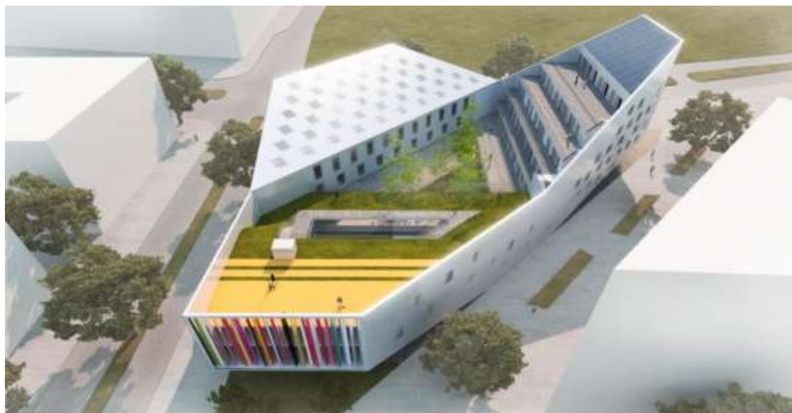
4-Rasm: The Euralille Yoshlar markazi. Fransiya, Lill