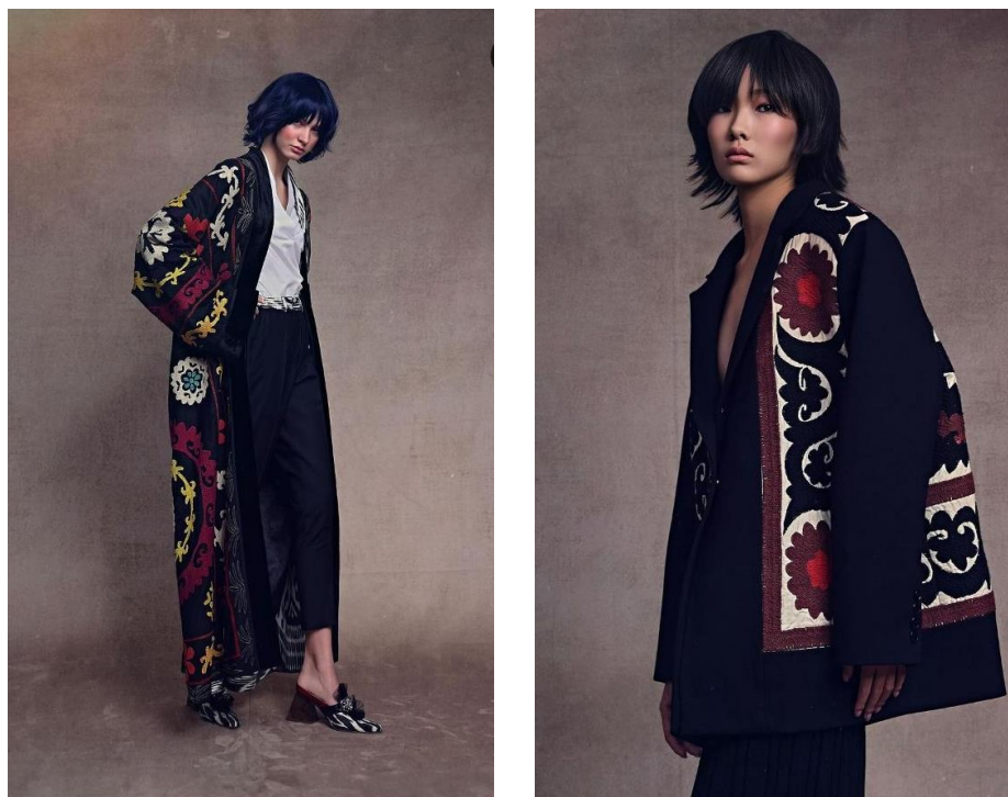
Рис.1. Устойчивая эко-мода, сделанная в Центральной Азии.

Коллекции Couture и RTW (готовая к носке) узбекского кутюрье Lali.