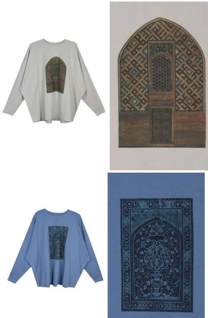
Рис.2. Одежда, аксессуары и предметы интерьера из натуральных материалов: кожа, мех, текстиль, ручная работа, мелкосерийное производство. Бренд KANISHKA