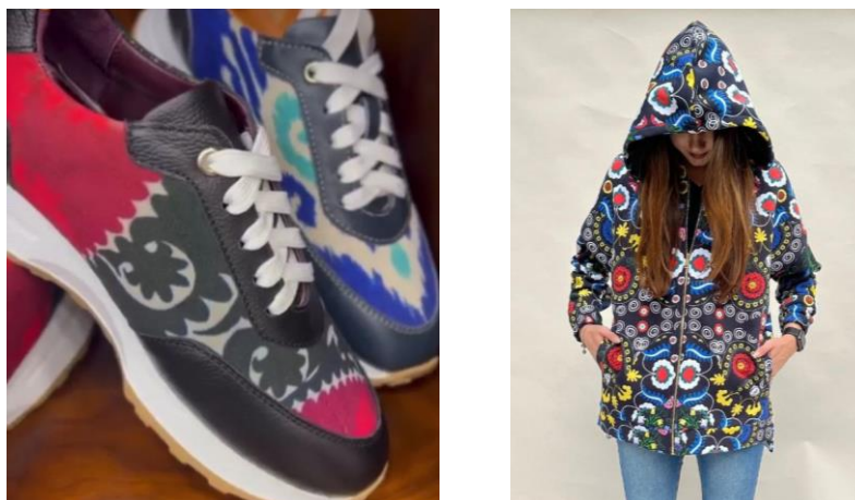
Рис. 3. Бренд Fratelli Casa