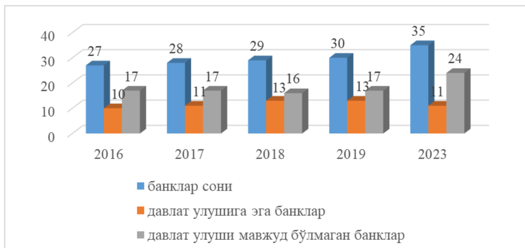
Манба: Статистик бюлетень (2019-2023) маълумотлари асосида тузилди