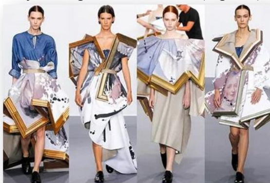
1-расм. Виктор ва Ролф либос тўпламлари

Гелдроп) ва Ролф Сноерен (1969 йилда туғилган, Донген) томонидан асос солинган голландиянинг авангард от-кутюр модалар уйи. [1] Йигирма йилдан ортиқ вақт давомида Виктор ва Ролф мода ҳақидаги олдиндан ўйланган тушунчаларга қарши чиқишга ва мода ва санъат ўртасидаги тафовутни бартараф етишга интилишди. Viktor & Rolf мода уйи ҳам юқори мода, ҳам тайёр либослар коллекцияларини яратиб келадилар. Бу дуэт ўзининг авангард дизайнлари яъни, концептуал коллекциялари билан машҳур бўлиб, улар асосан театр ва сахна кўринишидаги мода махсулотларини эслатади. (1-расм).