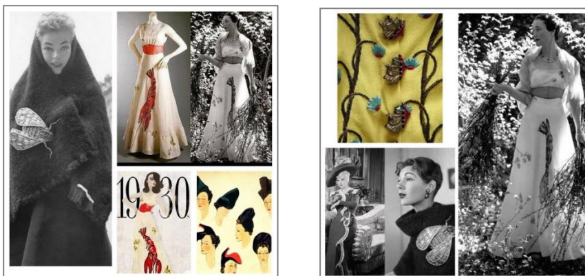
2-расм. Э.Скиапарелли яратган комтјом шакллари

Концептуал мода йўналишида ижод қилган илк мутахассис - XX асрнинг ёрқин кутьюреларидан бири бўлган Эльза Скиапареллидир. У яратган либослар ўз даврига нисбатан бир неча 10 йилликларга илгарилаб кетган концептуал тамойиллар асосида яратилган. Кутьюре ижодий концепцияларини шакллантириш жараёнида машҳур санъаткор, rassom Салвадор Дали билан коллаборациялари маълум бир маънода у яратган либосларнинг мода оламида барча даврлар учун юксак ҳисобланиб келинадиган либос тўпламлари яратишига замин бўлган (2-расм).