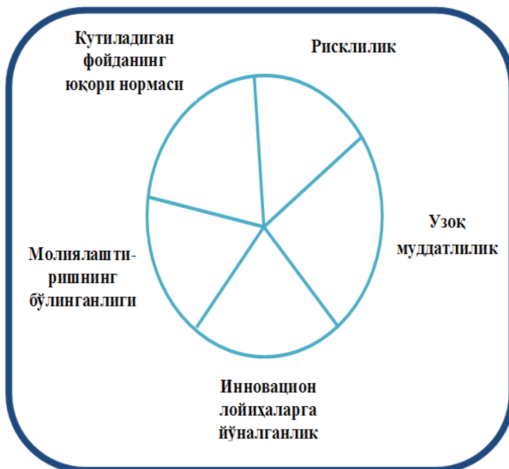
2-rasm. Venchr kapitalining o'ziga xos xususiyatlari.

Venchr kapitalining asosiy o'ziga xos xususiyatlarini 2-rasmda ko'rib o'tishimiz mumkin: