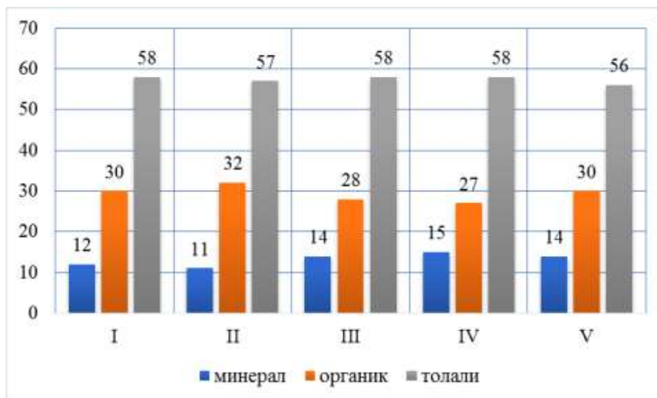
3-расм. Чигитни линтерлаш жараёнидан ажралаётган чиқиндиларнинг пахта саноат навлари бўйича фракцион таркиби

3-расмда чигитни линтерлаш жараёни келтирилган бўлиб, пахтани саноат навларининг пасайиши, I, II, III, IV, V- гача бўлганида минерал чиқиндилар 12,