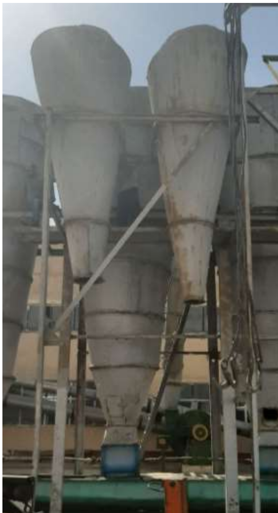
5-расм. Циклонларни ўрнатиш.

Корхонанинг пахтани тозалаш ва линтерлаш цехига ушбу схемада циклонлар йиғилди 5-расм.