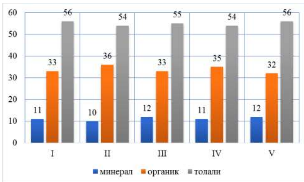
2-расм. Пахтани жинлаш жараёнидан ажралаётган чиқиндиларнинг пахта саноат навлари бўйича фракцион таркиби

органик чиқиндилар 33-35% га ўзгариб, энг кўпи толали чиқиндилар 54-56% га органини кўрамыз.