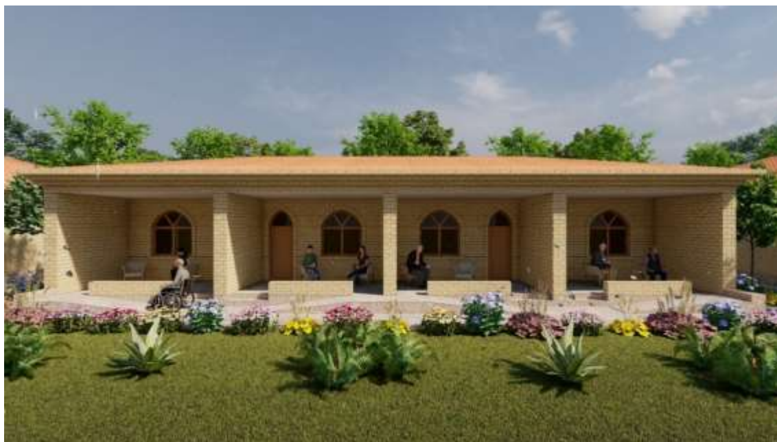
7-rasm. Yusuf Hamadoniyy ziyoratgohiga ziyorat va davolanish uchun kelgan ichki va tashqi turistlar uchun yangi ekoturistik mehmonxonlar taklif