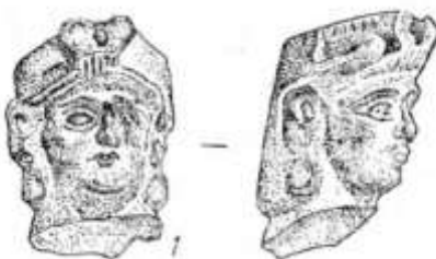
9-расм. Хумбузтепа. Терракотанинг бош қисми.

М. Мамбетуллаев раҳбарлигида Тошсақа зонасидаги Хумбузтепа ёдгорлигида олиб борилган археологик қазилмалар натижасида олинган сопол ҳайкалчалар Кўзалиқир ва Қалъалиқир-2 харобаларидан топилган терракоталар ясалиши ва шаклини такрорлайди (расм-9). [5, 28-б]