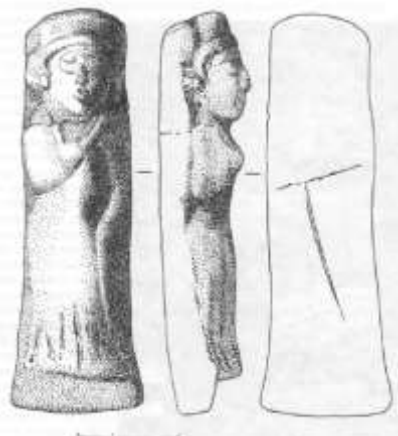
3-расм. 1 ва 2-тип.