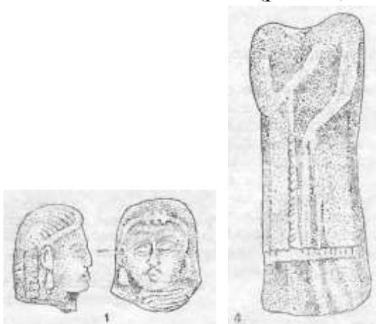
8-расм. Шовот Тупроққалъаси. Аёл терракота

топилган терракоталари Кўйқирилганқалъадан топилган ҳайкалчаларнинг типологик ўхшашидир. Олд томонидан ярим устун кўринишга эга, узун ва силлиқ кийимда қизил ангоб билан қопланган аёлнинг боши йўқ ҳайкалчаси тирсаки букилган ҳолда ўнг кўлининг кафти кўкрагида турибди, чап кўли эса эгилиб қорин қисмида турибди. Тадқиқотчи, фикрича, ўзининг умумий кўриниши ва безагининг алоҳида элементлари билан уни баъзи Яқин Шарқ (Оссурия-Бобил ва Кичик Осиё) тасвирлари билан таққослайди ва “устунли терракота одатда худонинг дарахт танасида мужассам бўлиши ғояси билан боғлиқ, бу бежиз эмас, чунки дарахтни илоҳийлаштириш дунёнинг кўплаб халқлари учун одатий бўлган” деб таъкидлайди (расм-8). [4, 32-б]