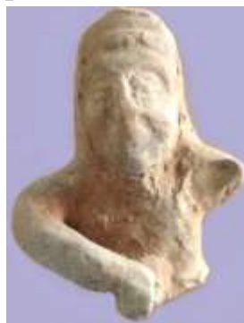
11-расм. Катқалъа (Шовот). Терракота бош қисми.

Тупроққалъа туманида “Арка бобо” фермер хўжалигининг ёдгорлик излари аниқ бўлмаган ҳудудидан Хумбузтепа ва Қалъалиқир ёдгорликларидан топилган терракота ҳайкалчаларининг айнан ўхшаши бўлган, бироқ ҳали ўрганилмаган, бадий жиҳатдан фарқ қилувчи тасвирга эга намунаси топилди. Унинг бош қисми сақланмаган, иккала қўли билан кўкрак қисмида муқаддас китоб ушлаб турган қоҳин эркак кишининг қизил ангобли ҳайкалчаси бўлиб, бели қисиб боғланган калта камзулли эканлиги кўриниб турибди (тадқиқотчи терракотани “Авесто” музейига тақдим қилган). Баъзи қисмлари