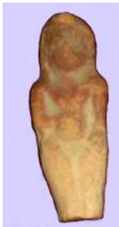
10-расм. Хумбузтепа. Аёл терракота

Қирққизқалъа, Қўйқирилганқалъа ёдгорликларидан топилган терракоталарнинг ўхшашидир. Аёлнинг ўнг қўли тирсақдан букилган ҳолда кўкрагига қўйилган, чап қўли қорин қисмига қўйилган тик турган ялонғоч ёки енгил либосли кийим кийган ҳолдаги тасвирни намоён қилади (расм-10).