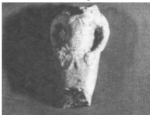
2-расм. Қалъалиқир-2. Эркак ҳайкалчаси.

Тадқиқотчи Б.И. Вайнберг Қалъалиқир-2 ёдгорлигида олиб борган изланишлари натижасида фақат битта бошсиз эркак терракота ҳайкалча топилган – шими устига пастга туширилган тарзда кўйлак кийган, олдида камар боғланган. Кўйлакнинг билагида текис тикувлар мавжуд бўлган (расм-2). Қолган барча сопол ҳайкалчалар аксарини аёл терракоталар ташкил қилган бўлиб, уни қуйидаги типларга ажратган: 1. Узун либос билан ўралган тик турган ҳайкалча; 2. Беланчак устки кийимда тик турган ҳайкалча (расм-3); 3. Ям-яшил плашда (фижма билан) тик турган ҳайкалча ва ўнг қўлда шам ёки гул тутган (расм-4); 4. Яланғоч ҳолда тик турган ҳайкалча (расм-5); 5. Кўза тутган ҳолда тик турган ҳайкалча (расм-6). [2, 164-б]