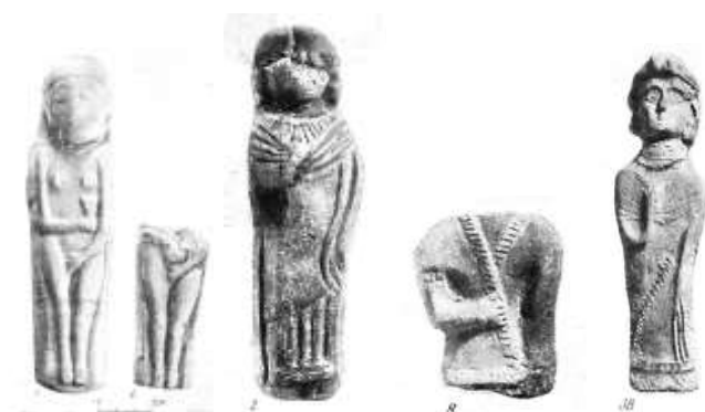
7-расм. Терракоталар. 1-2-Катта Қирққизқалъа. 3-5- Қўйқирилганқалъа.

Юқорида келтирилган гуруҳларга кирувчи ҳайкалчалар Катта Қирққизқалъа ва Қўйқирилганқалъа ёдгорликларидан ҳам топилган (расм-7). [3, 182, 338, 342-б]