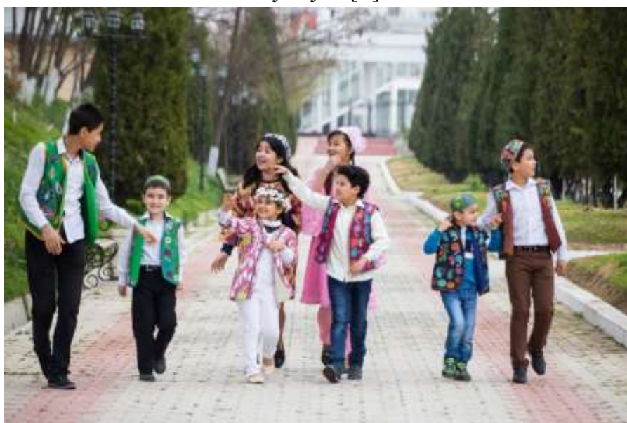
1-rasm. Milliy matolardan tayyorlangan bolalar kiyimlari [8].

Milliy kiyimlar millatimizning etnik madaniyatini ko'tarish jarayonlarini o'rganish vositasidir. Shuni ham ta'kidlash kerakki, bugungi kunda u o'zbek modasining zamonaviy liboslarini loyihalash jarayonida g'oya va manba sifatida muhim ahamiyatga ega bo'lib, unga bevosita ta'sir ko'rsatadigan o'ziga xos xususiyatlarga ega. Ayniqsa, mamlakatimiz modasida "kamtarona moda" ning sinteziga asoslangan dizayn mexanizmlarini amalga oshirish uchun muhim metodologik manba sifatida muhim rol o'ynaydi [6].