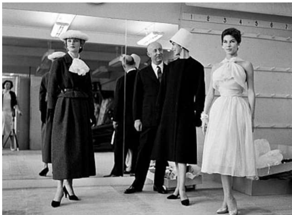
5-rasm. Dior modellar bilan.