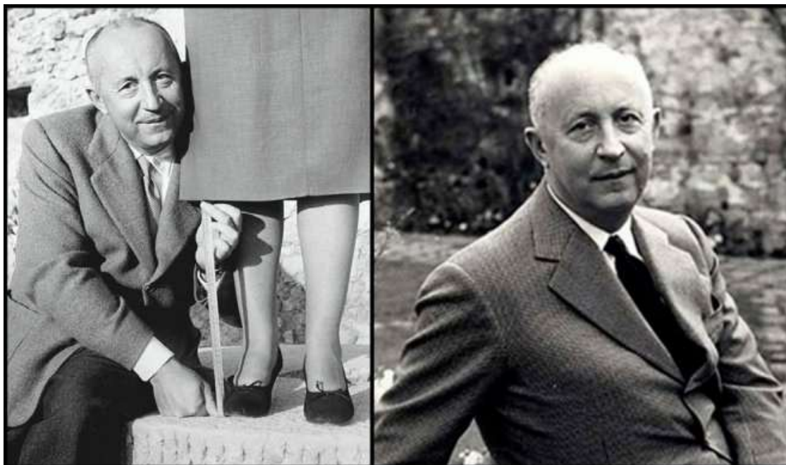
4-rasm. Kristian Dior

kutyure qaychi olib, vintajli kiyimlardan uzun etaklarini kesib tashlagandek edi. Qo'ng'iroq kabi butunlay yangi siluet paydo bo'ldi. "Gul tojlari" - bu tasodifiy nom emas, balki Dior go'zallik timsoli deb hisoblagan gular ushbu kiyimlarni yaratishda ilhom bergan edi, liboslar silueti go'yo gul kurtagiga o'xshardi. Kutyurening o'zi yoqtirgan ranglari kulrang va pushti bo'lgan va bu ranglarni nazokatli rang deb hisoblagan va har qanday matoga mos keladigan nafislik ramzi deb atagan. To'plamlarda asosan tabiatda uchraydigan boshqa ranglar ham bor edi. Birinchi to'plamda pastel diapazoni eng keng tarqalgandi. Kutyure oq, qora va pushti ranglarni muvaffaqiyatli birlashtirilgan turli xil soyalarni ajratib ko'rsatdi. Dior o'zining aniq afzalligiga qaramay, turli xil soyalarga asoslangan modellarni yaratdi. Kutyurening oxirgi rangi yaxshi kayfiyat, quvonch va ayollik ramzi edi. Fransuz iqtidorli dizayneri Kristian Dior ayollar modasida "Yangi ko'rinish" ya'ni "New look" yo'nalishining paydo bo'lishiga sababchi bo'ldi. Uning orzusi 19-asrning hashamatli va romantik kiyimlarini qayta tiklash va ular bilan go'zal ayol tanasini bezash edi.