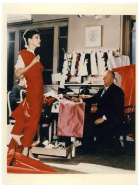
1-rasm. Diorning ijod jarayonlaridan namunalar.

1946-yil 16-dekabrda Dior Parijning Montel ko'chasida mo'jazgina modalar uyiga asos solgan. Dior Parijda 1947-yilning fevral oyida moda ixlosmandlariga New Look deb nomlangan kolleksiyani ya'ni To'qsonta modeldan tashkil topgan innovatsion to'plamini birinchi marta taqdim etgan. Dior uni "Corolla a gul" deb atadi.