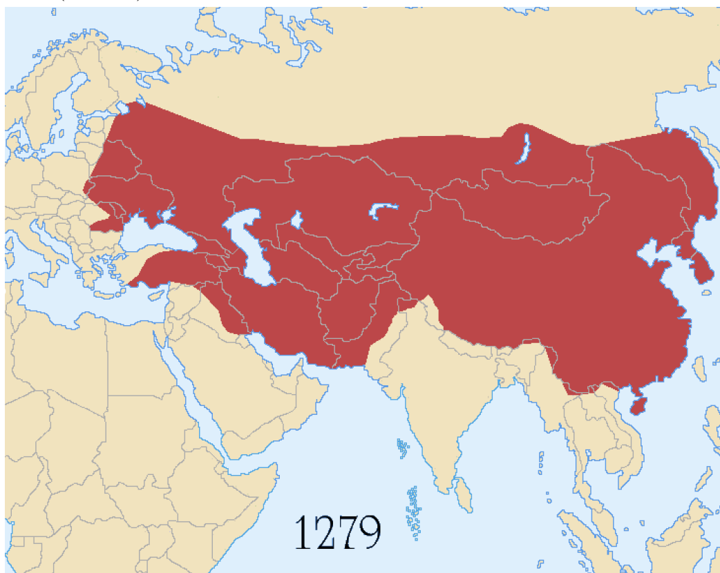
2-rasm. Mog‘ullar davrida Xitoy va Afg‘oniston hududlari

Xitoyda Tang sulolasining kelishi bilan, Afg‘oniston hududlariga bo‘lgan da‘volar kuchayib bordi. Tang sulolasi imperatorlari esa ushbu jarayonni harbiy yo‘l bilan amalga oshirish uchun yetarlicha kuch qudratga ega edilar. 659-yilda Sog‘d, Farg‘ona, Toshkent, Samarqand, Balx, Hirot va Kobul kabi shaharlar Xitoyning Gaozong pretektorati tarkibiga kirgan. Bu vaziyatda sosoniylarning arablar tomonidan mag‘lubiyatga uchratilganligi Xitoyga ustunlik bergan degan xulosaga kelishimiz mumkin. Mo‘g‘ullar davrida esa barcha hududlar yagona imperiya ostida birlashdi. (2-rasm)