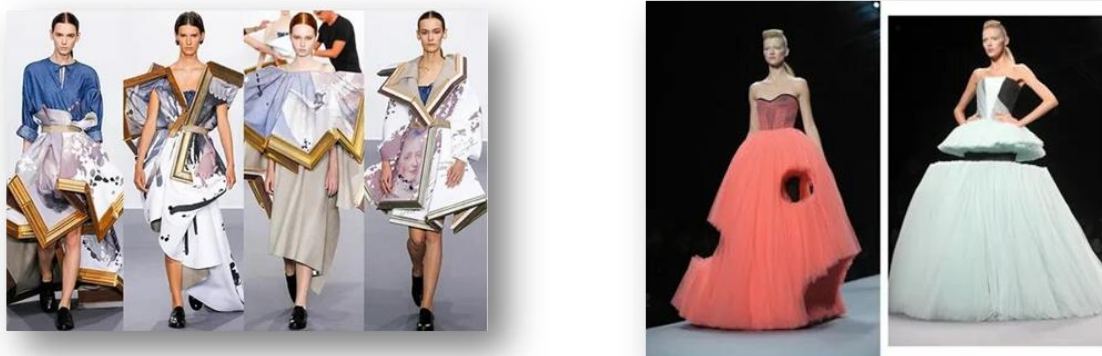
1-расм. Виктор ва Ролф либос тўпламлари

Гелдроп) ва Ролф Сноерен (1969 йилда туғилган, Донген) томонидан асос солинган голландиянинг авангард от-кутюр модалар уйи. [1] Йигирма йилдан ортиқ вақт давомида Виктор ва Ролф мода ҳақидаги олдиндан ўйланган тушунчаларга қарши чиқишга ва мода ва санъат ўртасидаги тафовутни бартараф етишга интилишди. Viktor & Rolf мода уйи ҳам юқори мода, ҳам тайёр либослар коллекцияларини яратиб келадилар. Бу дуэт ўзининг авангард дизайнлари яъни, концептуал коллекциялари билан машҳур бўлиб, улар асосан театр ва сахна кўринишидаги мода махсулотларини эслатади. (1-расм).