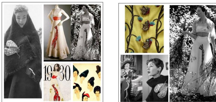
2-расм. Э.Скиапарелли яратган комтјом шакллари

Концептуал мода йўналишида ижод қилган илк мутахассис - XX асрнинг ёрқин кутюреларидан бири бўлган Эльза Скиапареллидир. У яратган либослар ўз даврига нисбатан бир неча 10 йилликларга илгарилаб кетган концептуал тамойиллар асосида яратилган. Кутюре ижодий концепцияларини шакллантириш жараёнида машҳур санъаткор, rassom Салвадор Дали билан коллаборациялари маълум бир маънода у яратган либосларнинг мода оламида барча даврлар учун юсак ҳисобланиб келинадиган либос тўпламлари яратишига замин бўлган (2-расм).